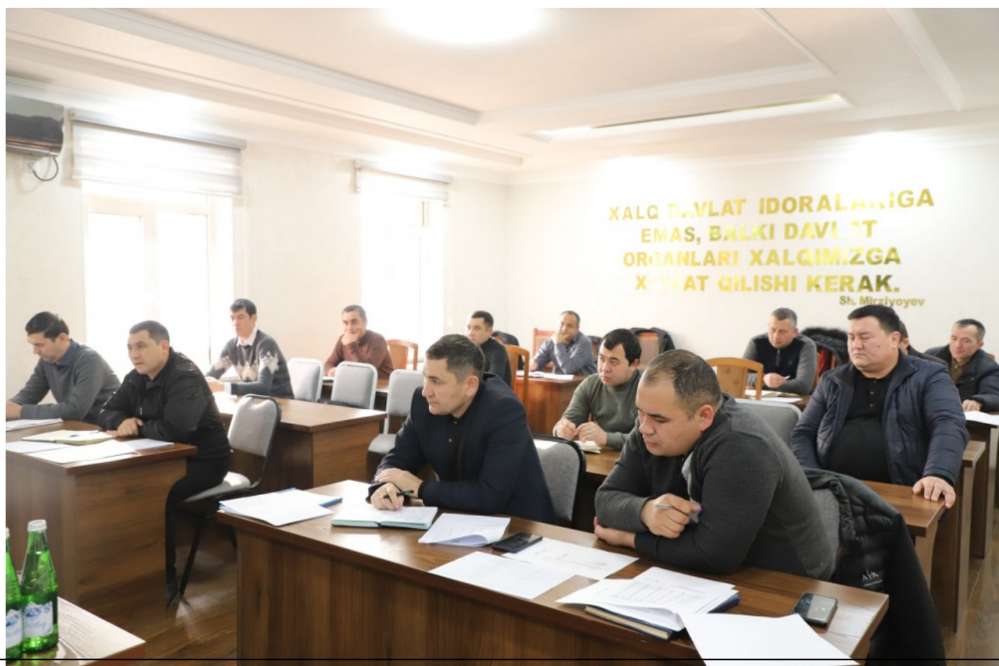
Анжуманда Фурқат туманининг саноат маҳсулотлари ишлаб чиқариш ҳажмларида 217 ўсиш суратларига эришиш учун ҳудудлардаги мавжуд имкониятлар ва қўшимча захираларни аниқлаш, шунингдек, модернизация ёки реконструкция қилинаётган корхоналарни ўз вақтида ишга