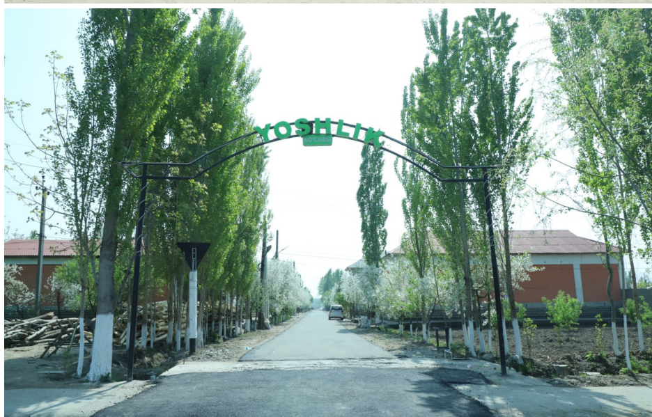
Ташаббусли бюджет жараёнининг 2023-йил 2-босқичи

Ташаббусли бюджет жараёнининг 2023-йил 2-босқичи учун туман маҳаллий бюджетида маъқур жараён учун жами 4 010,0 млн.сўм маблағ ажратилган бўлиб, туман фуқаролари томонидан жами 138 млрд. 895 млн сўмлик 126 та таклиф киритилган. Ишчи комиссия аъзолари томонидан киритилган таклифлар, Низом талаблари асосида кўриб чиқилиб, тегишли хулоса берилди ҳамда